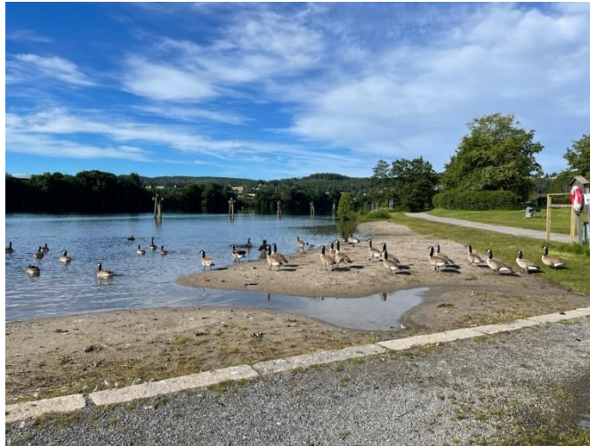
Prøvetaking i Øvrebøtjønn og bilde av Canadagjess på Bakkestranda

I 2022 inngikk Miljørettet helsevern i Grenland et samarbeid med kommunalteknikk i Drangedal kommune. De tar prøver ved seks ulike badeplasser i kommunen og sender prøvene til analyse. Fra før har vi et samarbeid med Skjærgårdstjenesten i Kragerø. De tar prøver for oss og sender prøvene med budbil til laboratoriet i Porsgrunn for analyse. Kommunalteknikk i Skien kommune gjennomfører prøvetaking av vann i nærheten av kommunens pumpestasjoner. Enkelte av pumpestasjonene er lokalisert i umiddelbar nærhet til etablerte badeplasser, blant annet Falkum bad og Hoppestadelva. Miljørettet helsevern i Grenland mottar disse prøveresultatene, vurderer dem og publiserer dem sammen med de øvrige badevannsresultatene. Miljørettet helsevern i Grenland tar selv prøver ved 13 badeplasser i Bamble, Porsgrunn, Siljan og Skien (se Tabell 4).