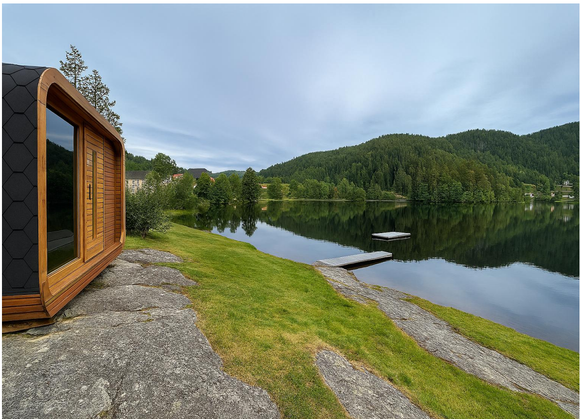
Badstue ved Øverbøtjønn, Siljan kommune. Bildet er redigert ved bruk av KI.

Rapporten er skrevet av Miljørettet helsevern i Grenland mars 2026