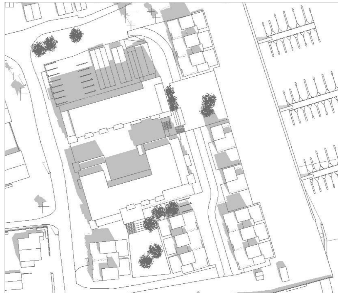
21. juni kl 12:00