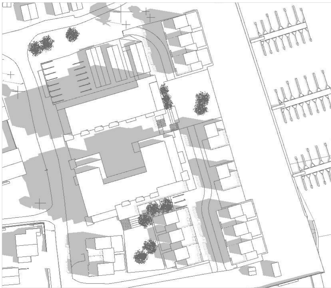
21. juni kl 09:00