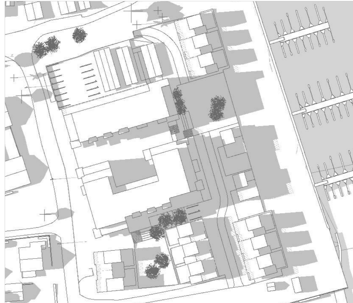
21. juni kl 18:00