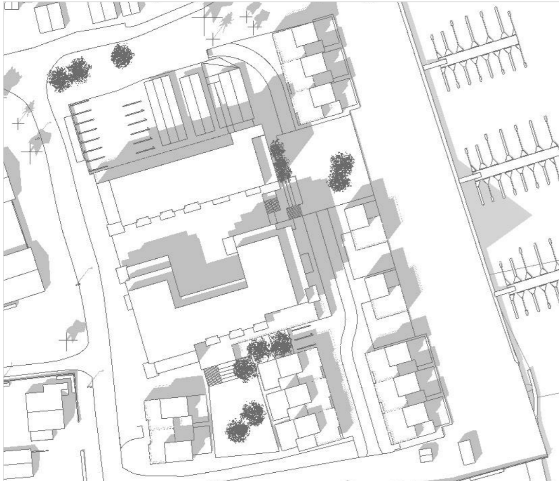
21. juni kl 15:00