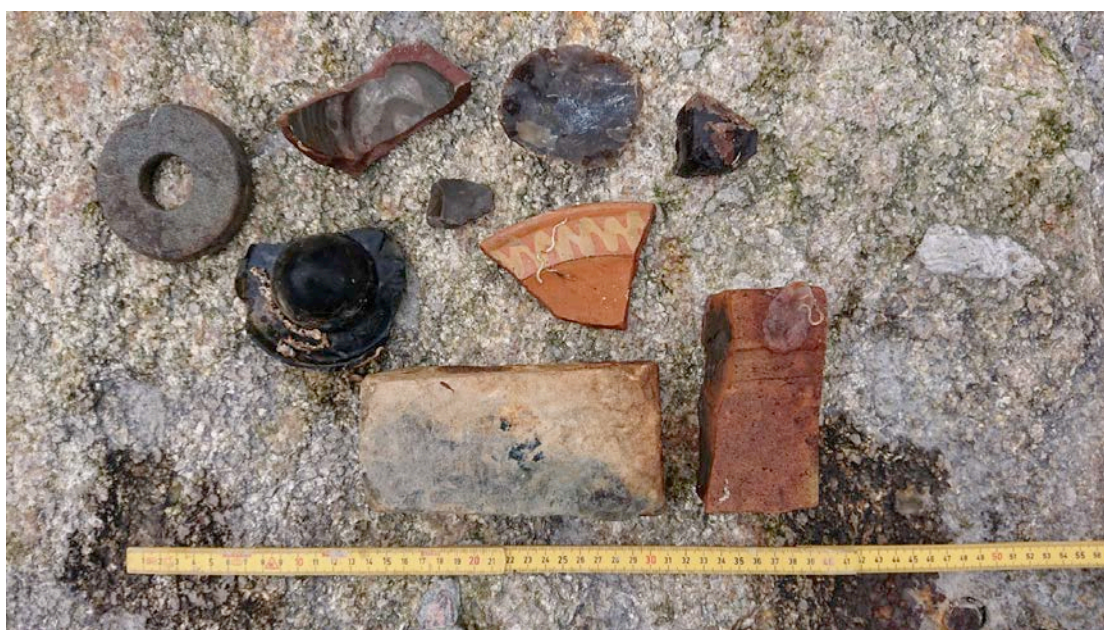
Fig. 6 Provmateriale fra haugene med ballastflint, glass, tegl og keramikk.