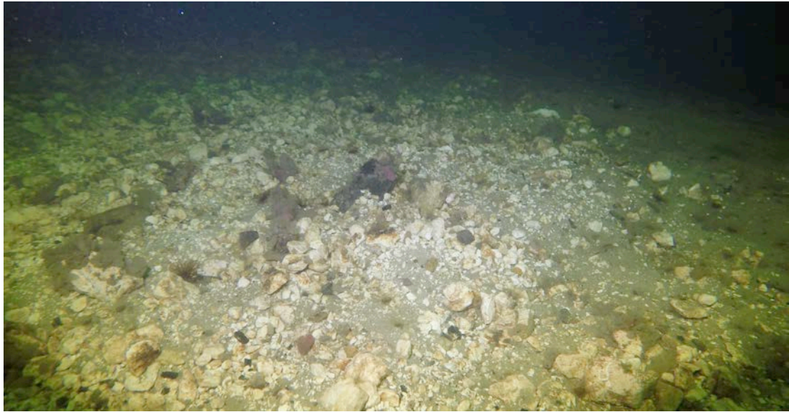
Fig. 4 Id. 268802 Ballastroys, vesentlig flint og kalk