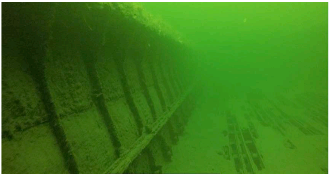
Fig. 3 Id. 268800 ställesterinnvendig, delvis bevarat tredekk i lasterom