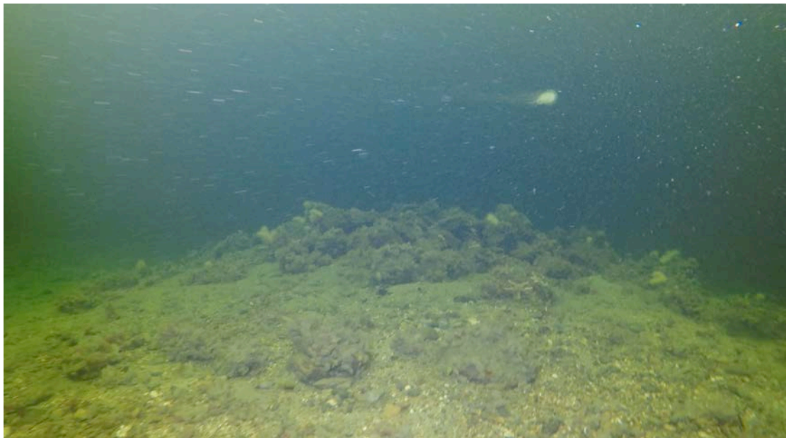
Fig. 5 Id. 268803 Ballastroys bestående av vannrullet naturstein og gul teglstein