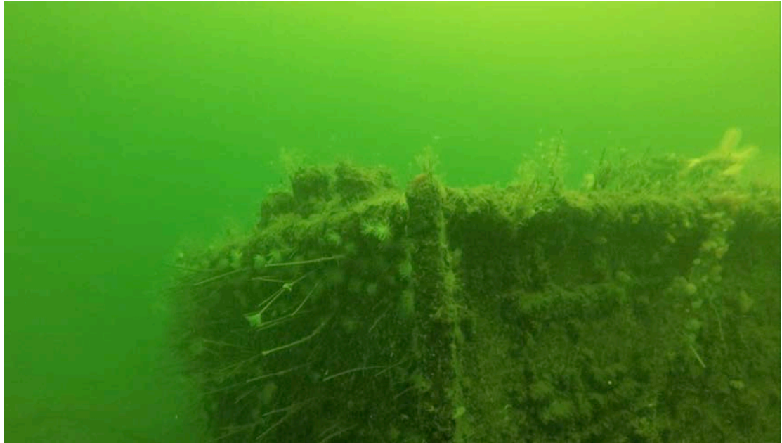
Fig. 2 Id. 268800 bygparti av ställester