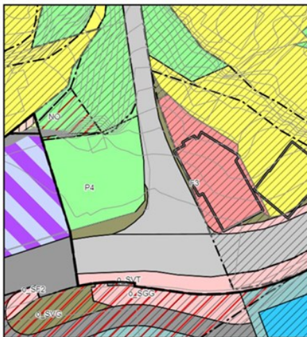
Utsnitt av gjeldende reguleringsplan.

I samråd med Porsgrunn kommune er det vurdert at endringen «...i liten grad vil påvirke gjennomføringen av planen for øvrig, ikke går utover hoveddrammene i planen og heller ikke berører hensynet til viktige natur- og friluftsområder», jfr. plan- og bygningsloven § 12-14. Slike endringer, tidligere kalt «mindre endring», gjennomgår en enklere planprosess.