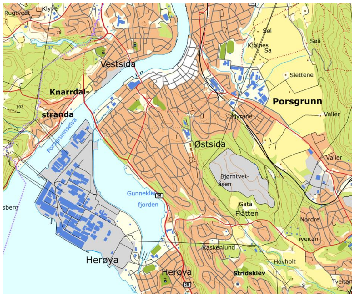
Fig. 1 – Gunnekleivfjordens beliggenhet

Gunnekleivfjorden har utstrekning ca. 800daa., og lengde ca. 2km fra nord til sør. Fjorden ligger ca. 2km sør for bysenteret. Herøya Industripark (HIP), som dekker et areal på ca. 1,5 km 2 , ligger på vestsida av fjorden. Riksvei 36 tangerer østsida av Gunnekleivfjorden – og Hydrovegen følger fjordkanten på vestsida. I nord er Gunnekleivfjorden forbundet med utløpet av Porsgrunnselva. I sør danner Herøyakanalen en smal forbindelse mellom Gunnekleivfjorden og Frierfjorden. Arealbruk i området øst for fjorden preges i stor grad av sammenhengende boligbebyggelse.