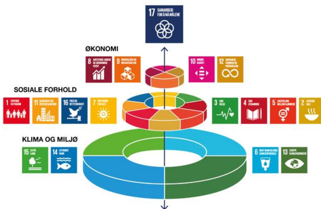
Figur 2: De tre pilarene for bærekraftig utvikling

FNs bærekraftsmål er verdens felles arbeidsplan for å utrydde fattigdom, bekjempe ulikhet og stoppe klimaendringene innen 2030. Disse målene skal også legge premisser for arbeidet med kommuneplanen, og i planarbeidet skal det framkomme hvordan Porsgrunn kommune bidrar til å nå målene. I handlingsprogrammet 2022-2025 er det vedtatt verbalforslag at relevante bærekraftsmål for sosial, økonomisk og miljømessig bærekraft legges til grunn i kommende planprosesser.