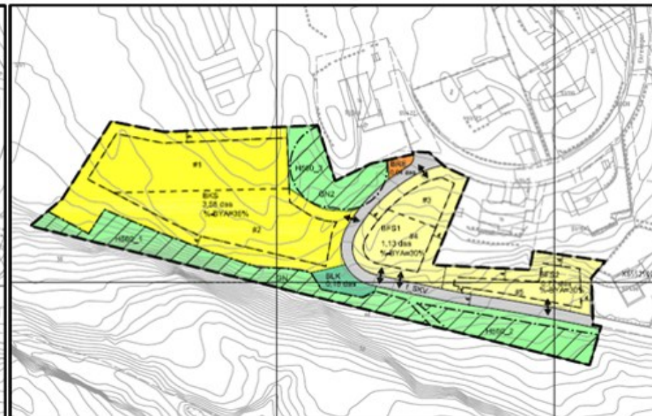
Figur 2 Revidert plankart