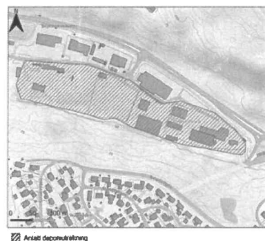
Figur 6: Oversiktskart over Skjelsvikdalen med antatt utstrekning av Sjelvika deponi, skravert med rosa.

- Det må ikke etableres tiltak som medfører at økt mengde overvann tilføres deponiet.