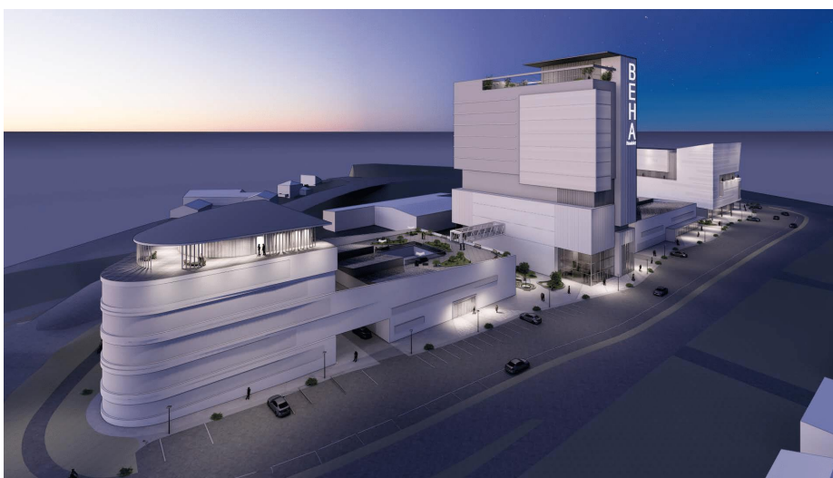
Mulighetsstudie Point Arkitekter, 2021

https://schanke-eiendom.no/schanke-eiendom-satser-hoyt-i-porsgrunn/