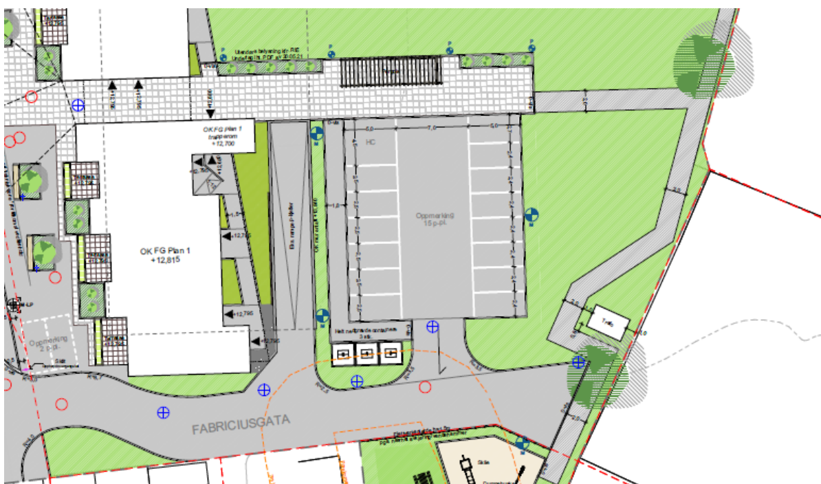
Utsnitt av foreslått utomhusplan med parkeringsareal

I gjeldende bestemmelser for torg T1 (vest for BB1) tillates utkragede balkonger fra BB1, maks 1,5 meter utkraget og minimum 2,8 meter over gateplan. I tillegg kan terrasser i 1. etasje etableres inntil 1 meter ut på torgarealet under utkragede balkonger. Det foreslås nå at dette også kan tillates på parkeringsareal P3 (vest for BB1).