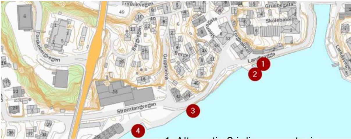
Figur 1: vurderte alternative plasseringer av ny fergekai.

Planendringen legger til rette for å gjøre om dagens parkeringsplass (se fig. 2) innenfor regulert havneformål til fergekai med 17 biloppstillingsplasser og infrastruktur. Plangrepet innebærer en mindre utvidelse av dagens kaianlegg, og endrer dermed eksisterende landskap noe. Planområdet er lokalisert sentralt i Breviks bybebyggelse innenfor 100-metersbeltet langs sjø og i et kulturmiljø av nasjonal interesse i Riksantikvarens NB! Register.