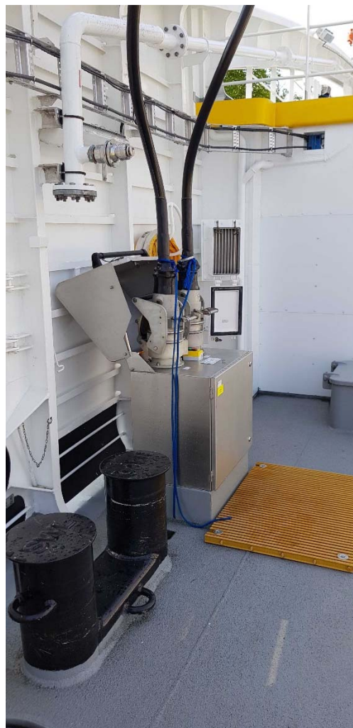
Figur 3: Foto av trafo og lådetårn på kai samt tilkoblingen om bord på hoveddekk.