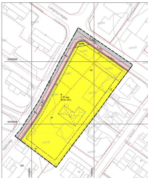
Figur 2 Plankart