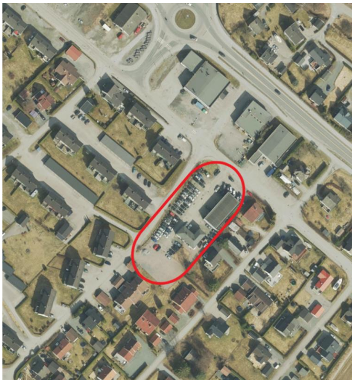
Figur 1 Oversiktskart