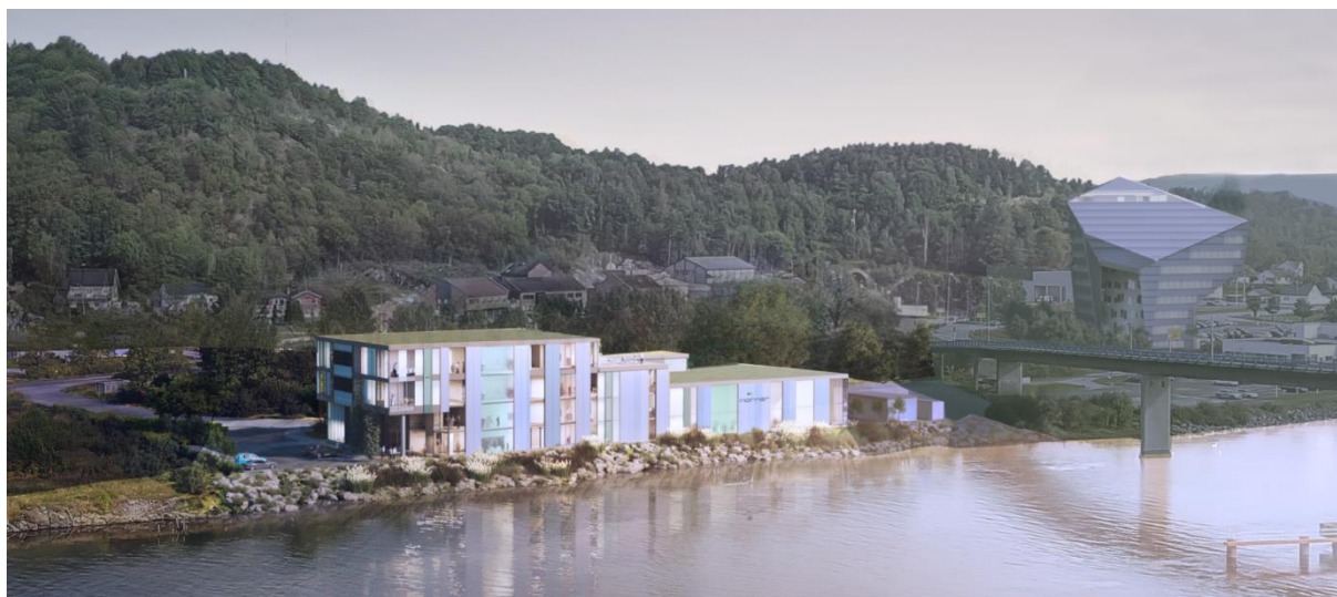
3D- illustrasjon av tiltaket

Tiltaket har en volumoppbygning med avtrappende form fra 4 et. mot vest og ned til 2 et. mot broen i øst. Grunnet komplekse lab.-arealer og behov for minimumshøyde 2,7 meter under himling og stor teknisk høyde over himling, er etasjehøydene satt til 3,65 m. Dette gjør at en maks gesimshøyde på 14 meter ikke er mulig å ivareta i et 4 etasjers industrielt bygg med disse funksjonskrav. Nye tekniske forskriftskrav stiller også krav til økt ventilasjon og tekniske føringer som krever større høyder enn det som var vanlig på tidspunktet for utarbeidelsen av de gjeldende planbestemmelsene. Vedlagte fasadetegninger viser en gesimshøyde ved 4 etasjer på kote 18,2, altså 15,5 meter over terrengnivå. Grunnet usikkerhet om isolasjonstykkelser, avrenning og fall på tak ønskes det i tillegg en margin på 0,5 m. Det foreslås derfor at tillatte gesimshøyder innenfor felt N9 økes fra 14 til 16 meter for 4 etasjer, og fra 11 til 12 meter for 3 etasjer. Det foreslås at inntil 50 % av bebyggelsen kan være i 4 etasjer.