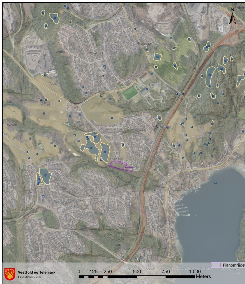
Figur 3. Kart som viser planområdet og kjente kulturminner i nærheten (markert med blå flater med gul sikringszone rundt og/eller blå rune-R).