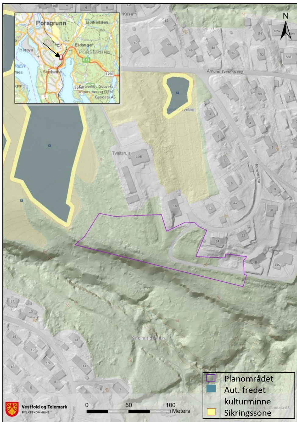
Figur 1. Planområdet) ligger på østsiden av Eidangerhalvøya, om lag 4 km sørøst for Porsgrunn sentrum.

Planområdet ligger på Tveten Søndre, gbnr. 51/1, i Porsgrunn kommune, om lag 4 km sørøst for Porsgrunn sentrum og ca. 1 km sørvest for Eidanger kirke. Planen omfatter mindre ubebygde områder på begge sider av Ekreveggen, rett nedenfor (sør og øst) for gårdstunet.