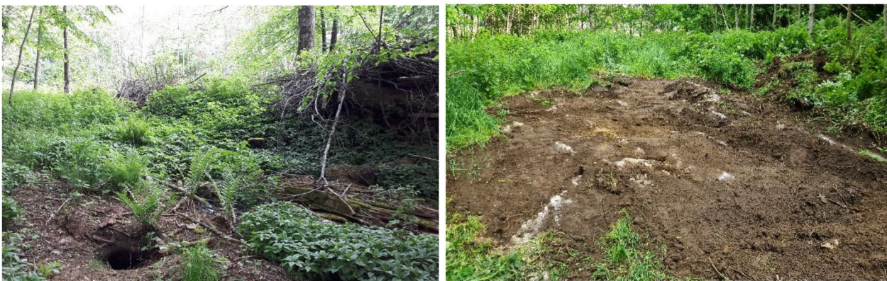
Figur 6: Fra undersøkelsen – prøvestikking til venstre. Til høyre sjakt 1.