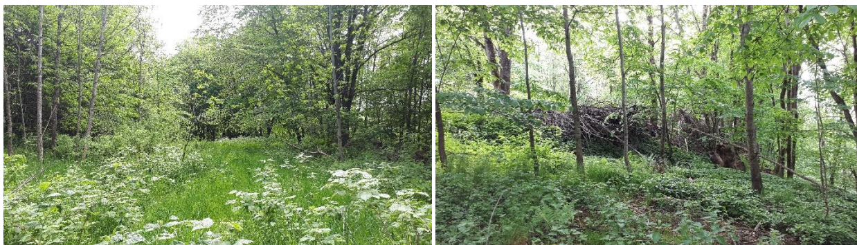
Figur 2. Terrengheskrivelser fra planområdet.

Planområdet er drøyt 8,5 mål stort og ligger på en terrasse i nedkant av og i forlengelse av dyrka mark. Terrassen heller svakt fra nordvest mot sørøst. Mot sør stuper terrenget bratt ned mot Kromsdalen. Planområdet gjennomskjæres av lave nordvest-sørøstgående bergrygger. Området ligger i dag brakk og er bevokst med til dels verneverdig løvskog (jfr. Statsforvalterens uttale).