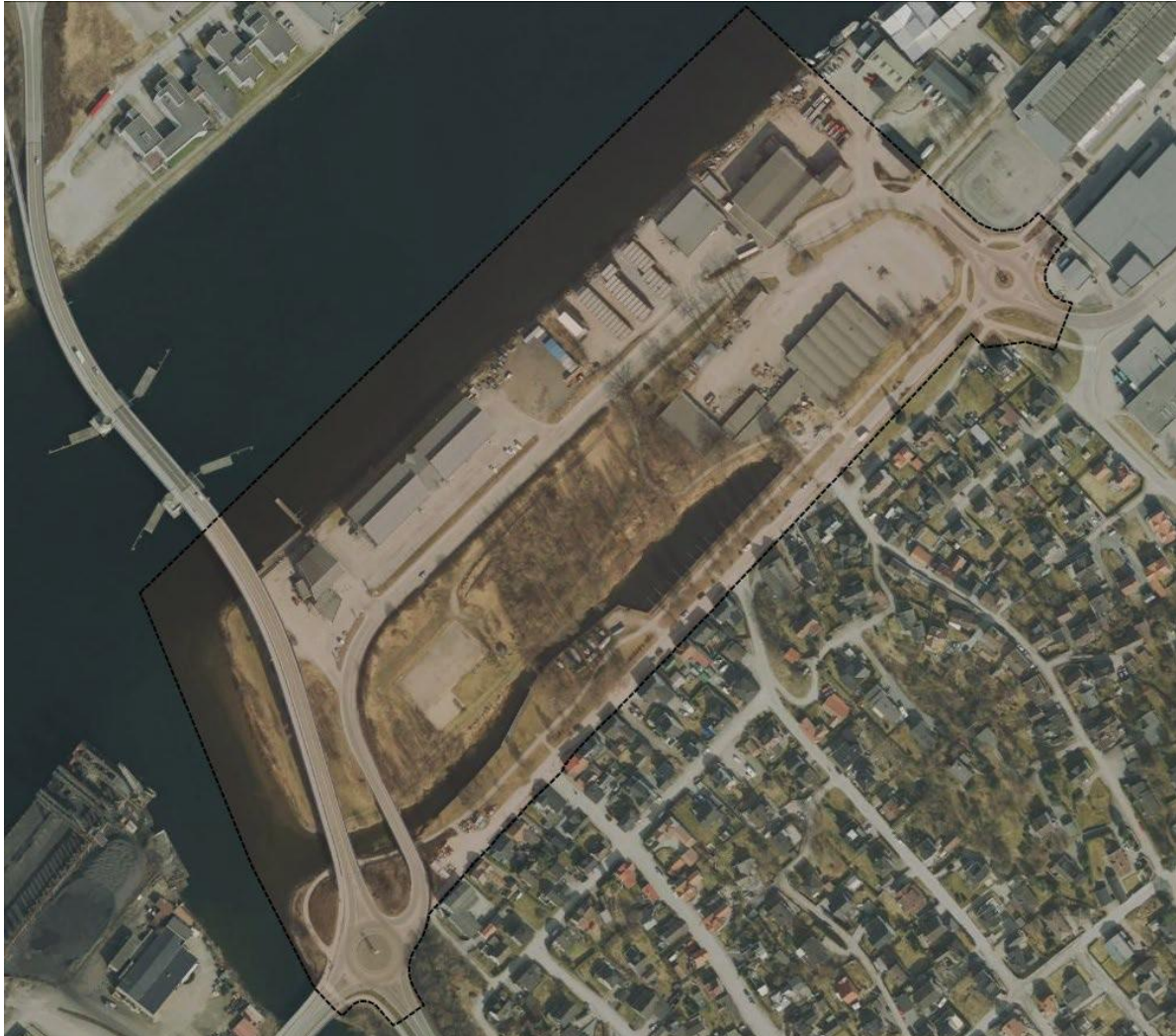
Figur 1. Lokalisering av planområdet for Nedre Frednes i Porsgrunn kommune.

Risiko- og sårbarhetsanalysen er utarbeidet i forbindelse med detaljregulering av området Nedre Frednes i Porsgrunn kommune. Figur 1 viser et oversiktskart med lokalisering av planområdet.