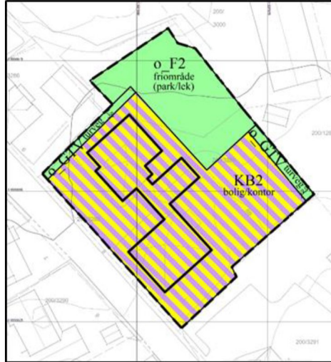
Forslag til planendring

Informasjon om endringene finner du vedlagt og på Porsgrunn kommunes nettsider under «Høringer»: https://www.porsgrunn.kommune.no/lokalpolitikk/hoeringer/