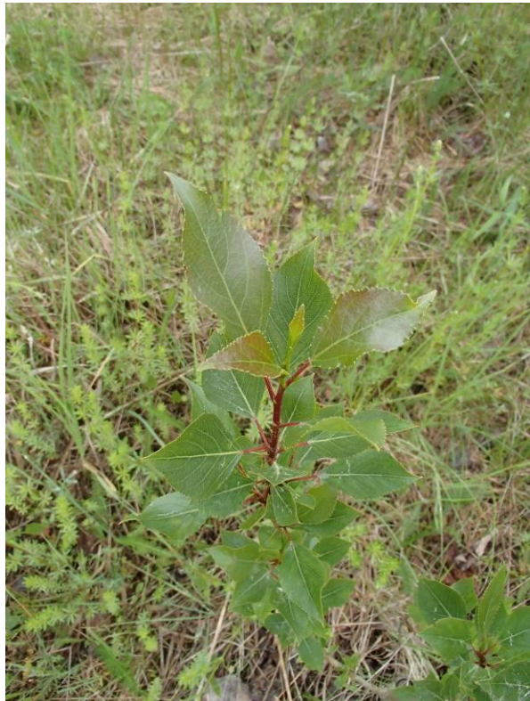
Den ubestemte poppel-arten.