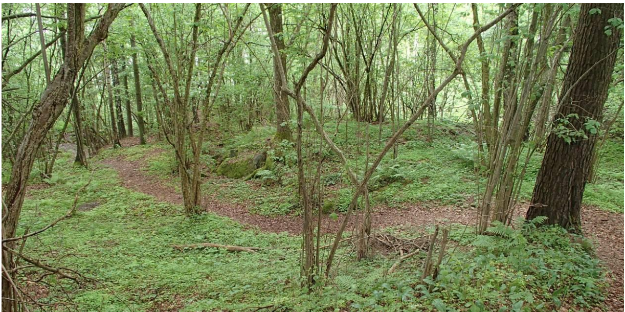
Søndre del av naturområdet GF1.

Konklusjon: Det er lite her som er til hinder for en utbygging, men friområdet i nord bør utvides noe sørover, opp til toppen av brinken, og inkludert de tre store furuene. Og det må tas hensyn til fremmedarter/svartelistearter.