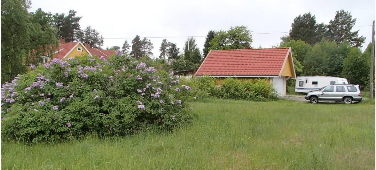
Syrin til venstre i bildet, parkslirekne like foran garasjen.

Tomt 6, nordre del av BFS3: kanadagullris, parkslirekne, syrin