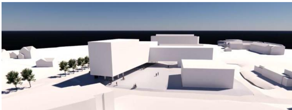
Illustrasjon av konsept utarbeidet av Code Arkitektur AS.

Planforslaget er vist utviklet med 235 nye studentboliger i ett bygg på tomten, med en fordeling mellom kollektiv og enkleter.