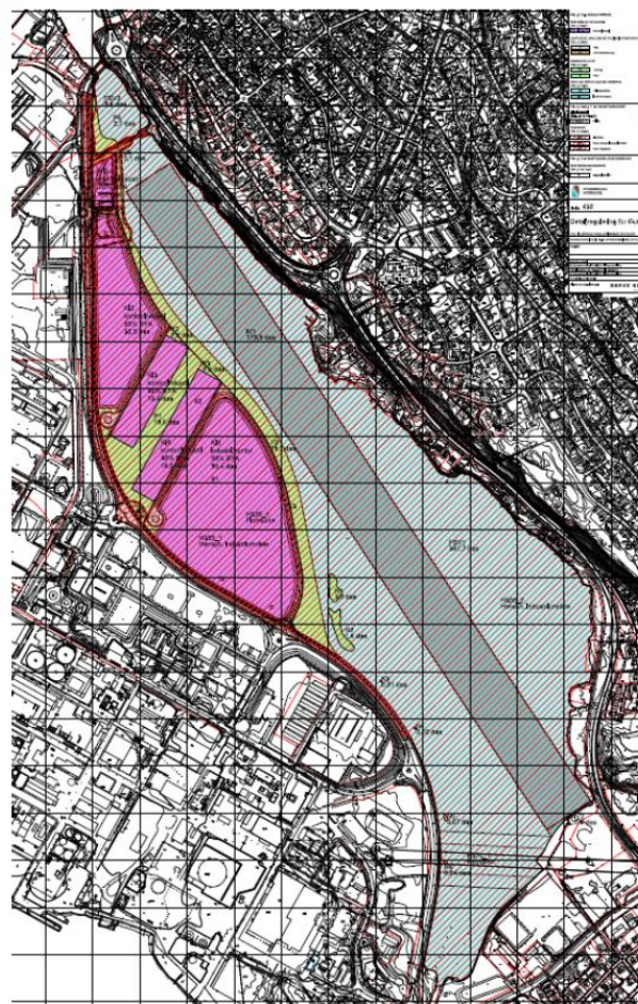
Figuren viser forslag til endret form.