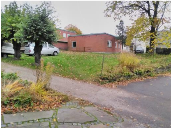
Figur 3: Baksiden av eiendommen