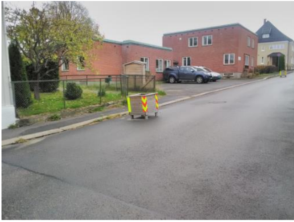
Figur 2: Eiendommen fra adkomsten i Winthersgate