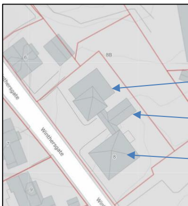
Tabell 1: Oversikt over bygninger tilhørende Winthersgate 8 (Statens kartverk)

Eiendommen ble utviklet som bolig for sognepresten og kontorer for menigheten rundt 1960. I 2006 flyttet sognepresten til egen bolig og bygningsmassen ble omgjort til kontorer for menigheten og kirkesjefens stab. I 2017 flyttet kirkestabene sammen i nye kontorer sentralt i byen. Siden den gang har bygningene stort sett stått tomme.