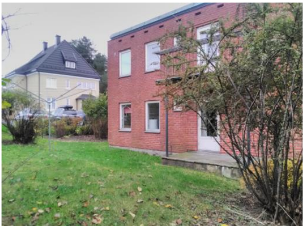
Figur 4: Bebyggelsen på eiendommen