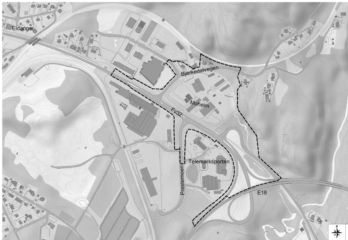
Figur 1 Varslet plangrense

Området som planen omfatter er en del av næringsområdet og vegsystemet på Moheim i Porsgrunn. Området ligger ved den østre innfartsvegen (Fv 32) til Porsgrunn og Grenland fra E18. Hele området er tidligere regulert til nærings- og vegformål (2009). Det er tre større T-kryss der i dag. Planområdet ligger i en svak helning mot sør og E18. Grunnforholdene er vist som sand og morenemasser i kvartærgeologisk kart. Utførte grunnundersøkelser underbygger dette, og det er ikke fjell i dagen andre steder enn langs Bjørkedalvegen helt i østre delen av planområdet. Det er til dels stor trafikk på hovedvegene, opptil 16000 i ÅDT (2019-tall). I mars 2021 ble det formelt varslet oppstart av reguleringsarbeid for dette området: