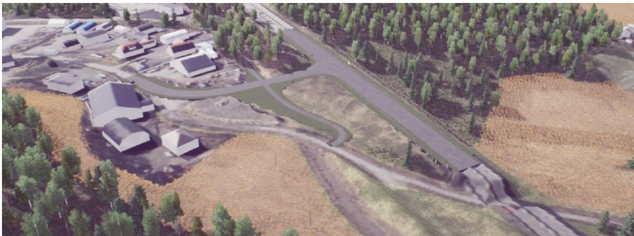
Nytt T-kryss til Lundedalen fra eksisterende E18.

Det planlegges et nytt kanalisert T-kryss på dagens E18 for adkomst til Lundedalen næringsområde. Eksisterende gangvei/skiløype vil krysse vegen i plan. Vegen til Lundedalen stenges for gjennomgangstrafikk mellom nærings- og skoleområdet.