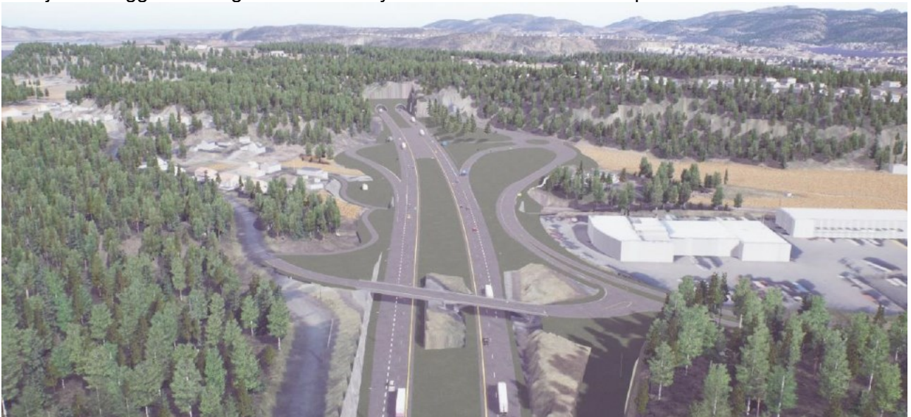
Kryssløsning på Kjørholt sett fra sør

På Kjørholt legges det til grunn et halvt kryss i form av sørvendte ramper.