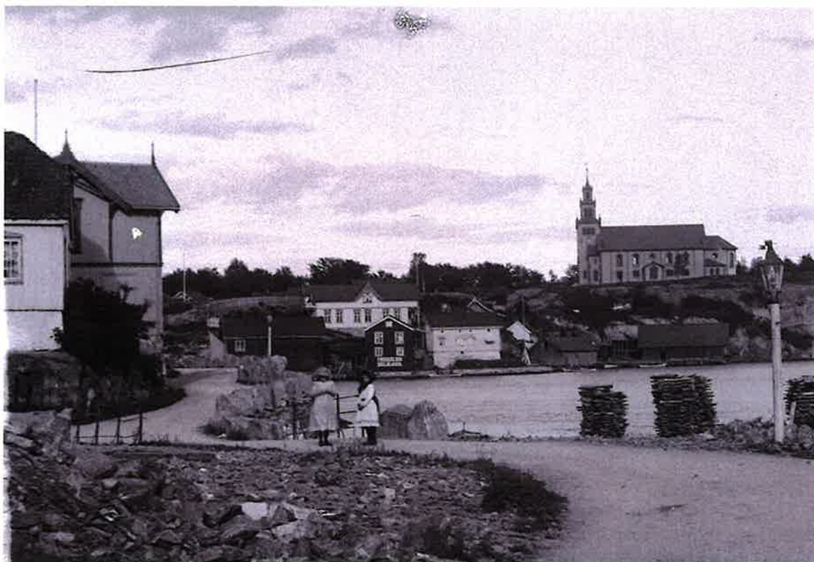
Gammelt fotografi fra 1903 av gropa ved Engelsbrygga hentet fra Facebooksiden «Brevik by».