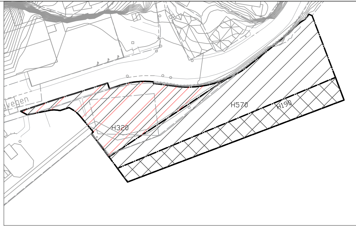
TEMAKART SOM VISER EKISTERENDE PLAN MED AREAL FOR PLANENDRING MARKERT MED STIPLET STREK. Opprinnelige bestemmelser fra 1989 etter Pbl 1985 gjelder hele planområdet med unntak av arealet innenfor stiplet omriss. Nye bestemmelser etter Pbl 2008 gjelder innenfor stiplet omriss.