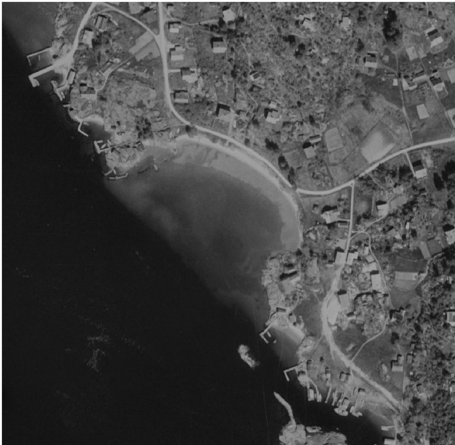
Figur 7: Historisk flyfoto over området fra 1965 (1881.no) før utfylling og etablering av molo og båthavn.