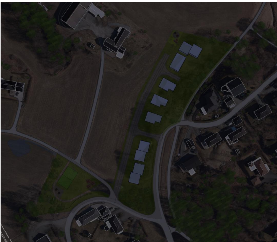
23. september kl.20