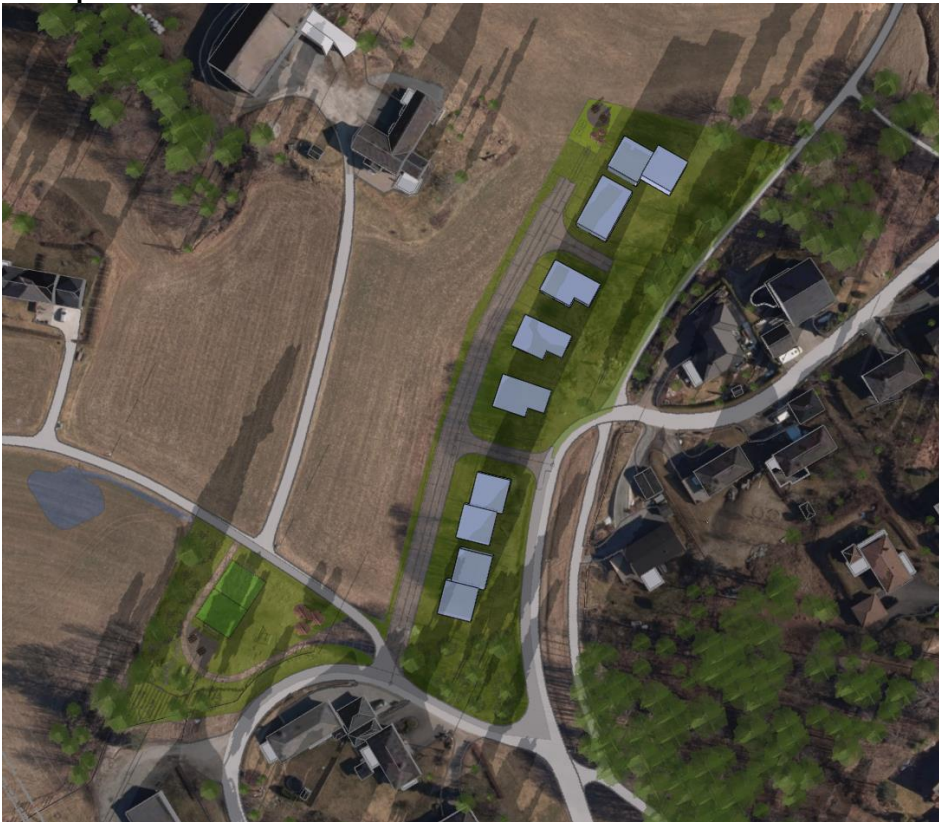
23. september kl.18