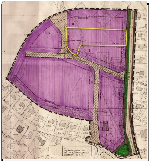
Utsnitt av gjeldende plan (tomt for Melkevegen 11 vist med gul grense)

Utsnitt av gjeldende plan og endret plan