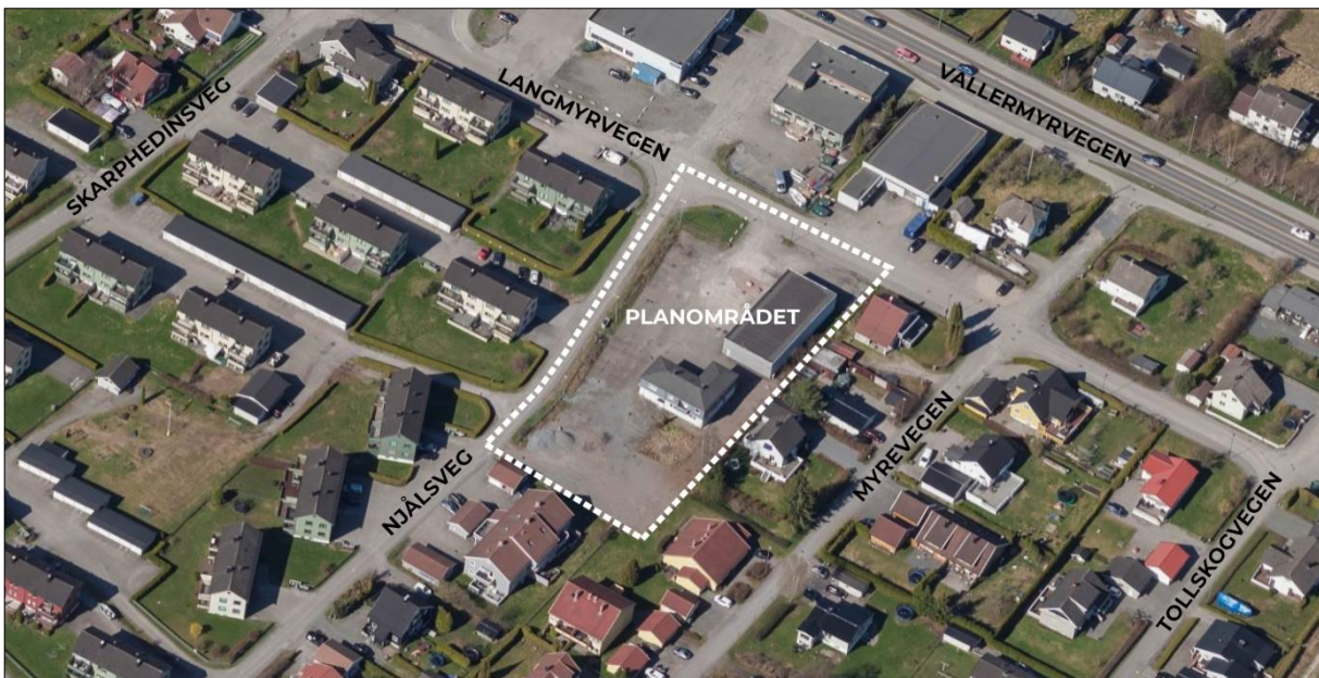
Planområdet og omkringliggende bebyggelse på Vallermyrene

Planområdet er avsatt som fremtidig boligformål (B18) i kommuneplanens arealdel og fremstår i dag som solrikt, åpent, flatt og lite utsatt for støy. Omkringliggende bebyggelse er i hovedsak på 1-3 etasjer, bestående av eneboliger og lave blokker, mot Vallermyrvegen er det næringsbygg. I dag er det to bygninger i planområdet, en bolig og et tidligere verkstedbygg som benyttes til treningssenter. Forslagsstiller ønsker foreløpig å beholde verkstedbygningen. Ellers er det lite/ingen vegetasjon på planområdet, store deler er gruset/asfaltert og benyttes til parkering.