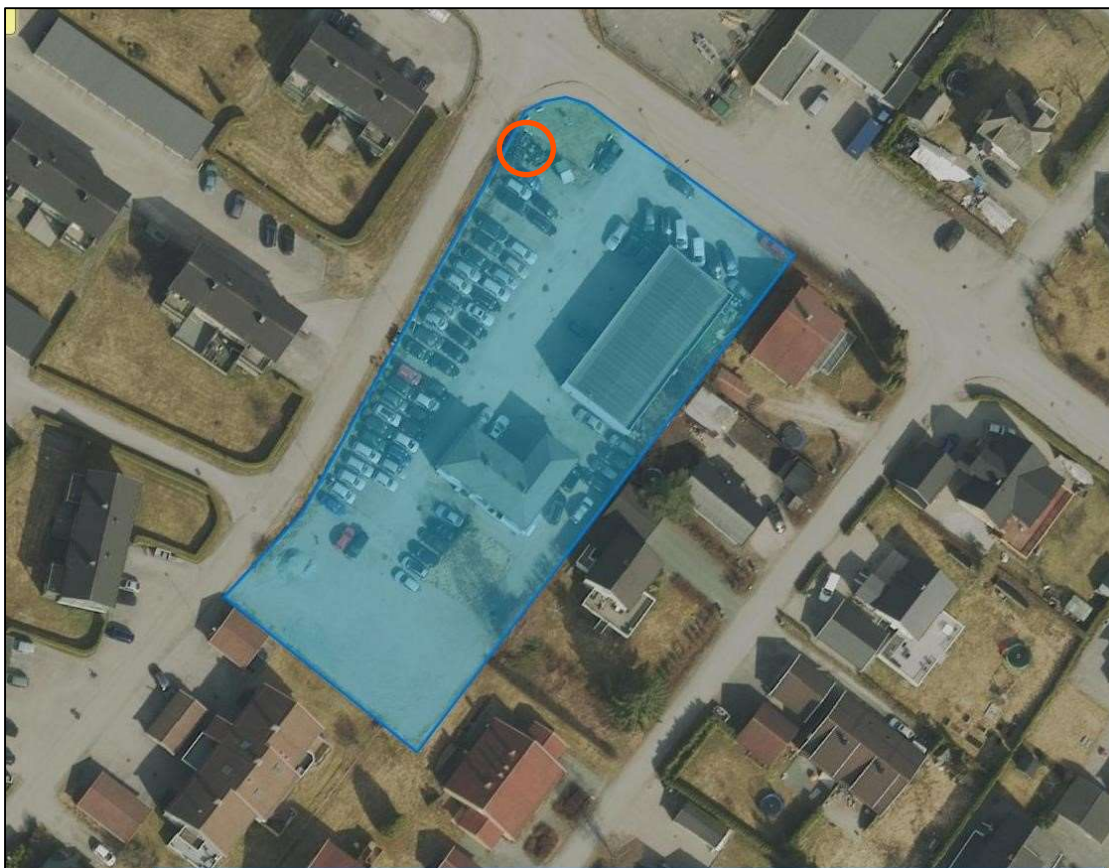
Figur 4: Flyfoto fra 2015. Tiltaksområdet er markert med blått. Området hvor det har vært lagret dekk er vist med rød sirkel