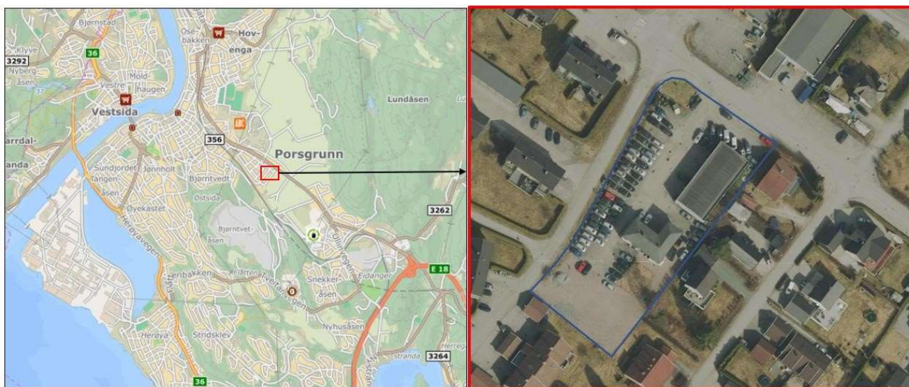
Figur 1: Viser et oversiktsbilde (venstre) og nærbilde av eiendommen Njålsveg 4 og 6 som skal reguleres til bolig.

Njålsveg 4, 6A og 6B i Porsgrunn kommune skal reguleres til boligbebyggelse. Det aktuelle området (heretter tiltaksområdet) har gnr 46 og bnr 422, 882, 883, 857 og 860 (Figur 1). Tiltaksområdet er på 4 daa. Asplan Viak har fått i oppdrag av Khaled eiendom AS å utføre en kartlegging av potensielle forurensede aktiviteter som kan ha vært på området. Kravet om å vurdere om det er forurenset grunn følger av forurensningsforskriften § 2-4.