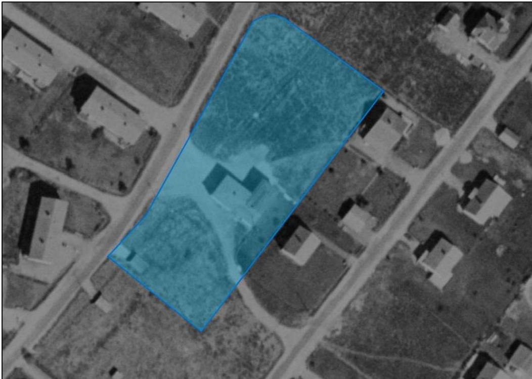
Figur 2: Flyfoto fra 1965. Tiltaksområdet er markert med blått

Flyfoto viser at det har vært lagret dekk i det nordre hjørnet av tomta. Dekk er en kjent kilde til utlekking av sink. Lagringsplassen er vist med rød sirkel i Figur 4.