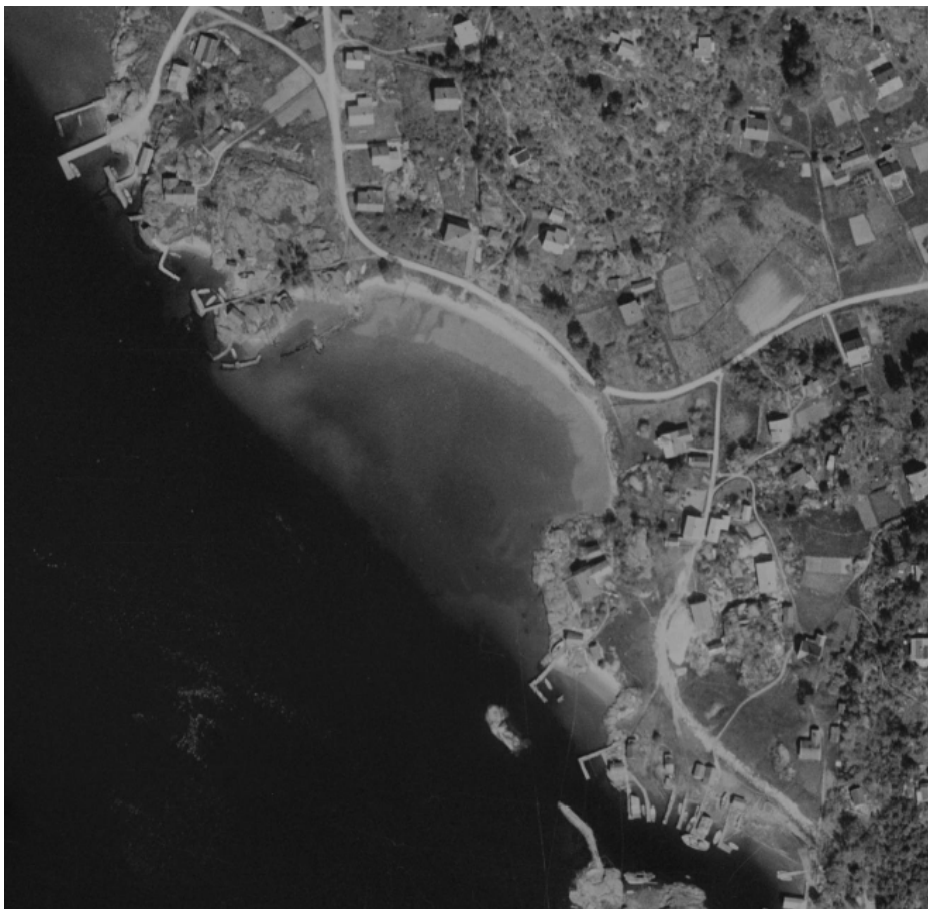
Figur 7: Historisk flyfoto over området fra 1965 (1881.no) før utfylling og etablering av molo og båthavn.