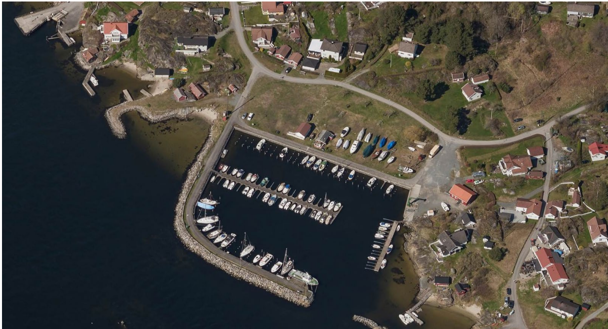
Figur 6: Skråfoto over influensområdet ( 1881.no)