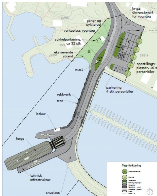
Illustrasjonsplan (vedlegg 4), Feste Sør AS

Det er rekkverk på begge sider av moloen fra fergekaia til landfestet, med tilgang til båtplasser på østsiden. Deler av molosletta benyttes til veg, venteplass for vogntog, og oppstillingsplasser for 16 personbiler. Her er også noen parkeringsplasser for bil og sykkel, og området rammes inn av vegetasjonsfelt. Eksisterende rest av strand bevares noenlunde som i dag, men noe areal nordøst for stranda blir til gangareal, da det står en mobilmast der gangarealet ellers ville blitt plassert. Se også vedlegg 5 for illustrasjon sett fra fjorden og sett fra fugleperspektiv.