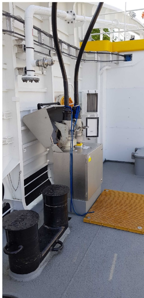
Figur 3: Foto av trafo og ladetårn på kai samt tilkoblingen om bord på hoveddekk.