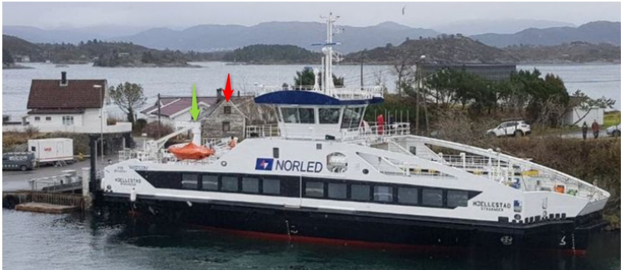
Figur 2: Fergen MF Hjeltestad ved kai i Klokkarvik. Sett fra sørvest. Lådetårn er markert med grønn pil og måleposisjon foran husvegg med en rød pil.