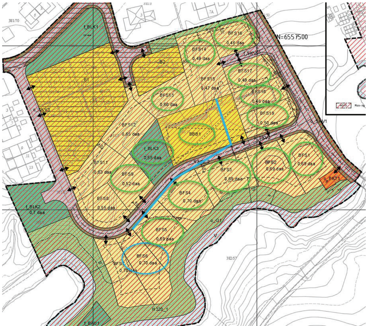
Figur 4 Avstand fra BFS6 til lekeplass f_BLK3.

Grønn sirkel viser tomter inntil 100 m avstand fra f_BLK3.