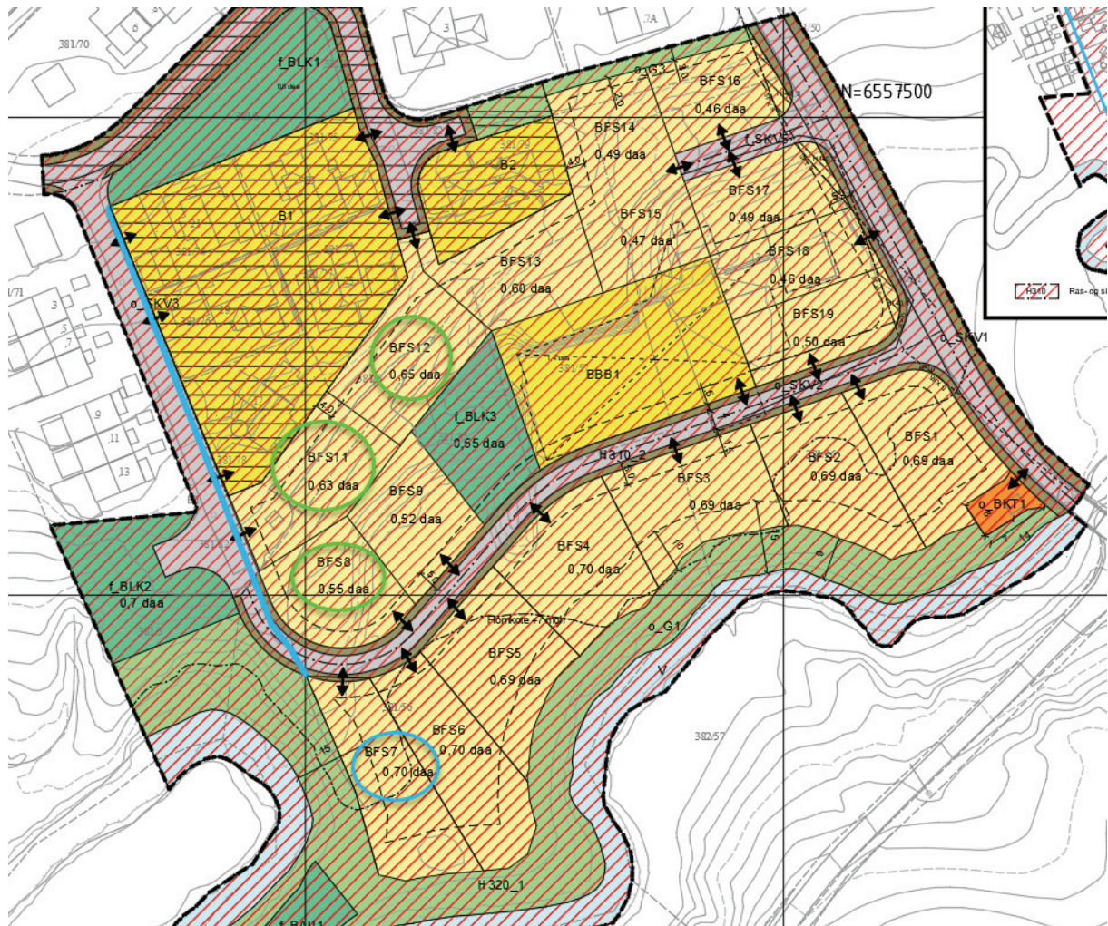
Figur 3 Avstand fra BFS7 til lekeplass f_BLK1.

Grønn sirkel viser tomter inntil 100 m avstand fra f_BLK1.