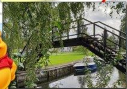
Ole Brums bru