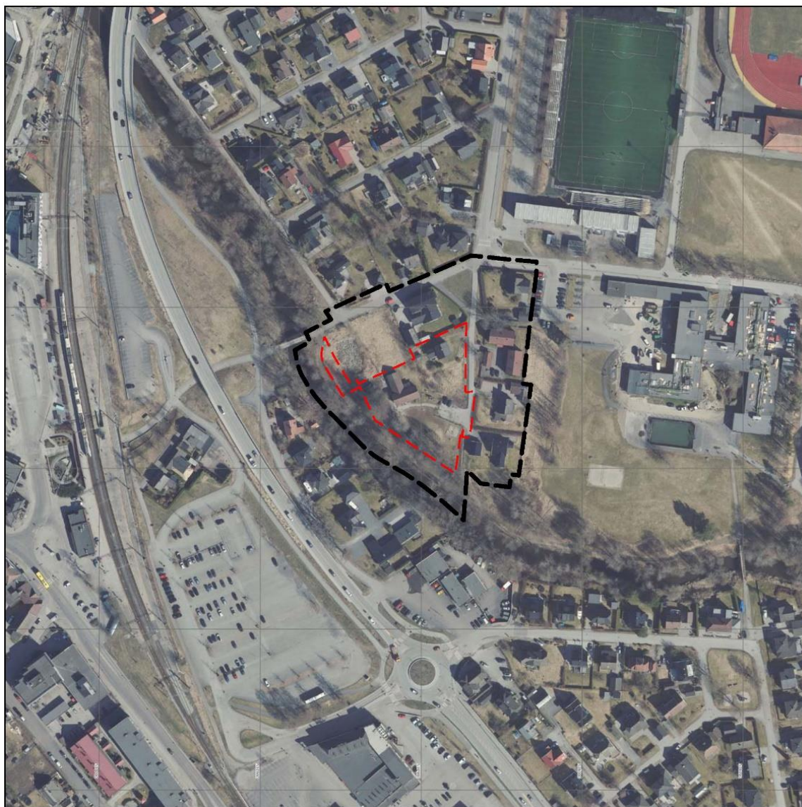
Figur 1, flyfoto som viser området som omfattes av endringene, avgrenset med rød linje. Planområdet er vist med sort linje.