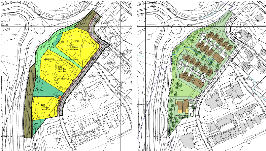
Plankart og illustrasjonsplan som ligger til grunn for planforslaget