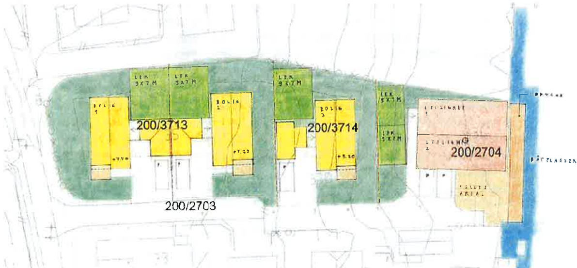
Situasjonsplan/illustrasjonsplan som ligger til grunn for planforslaget.