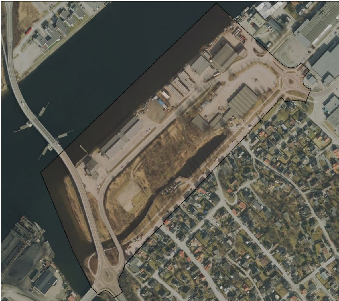
Figur 1. Lokalisering av planområdet for Nedre Frednes i Porsgrunn kommune.

Risiko- og sårbarhetsanalysen er utarbeidet i forbindelse med detaljregulering av området Nedre Frednes i Porsgrunn kommune. Figur 1 viser et oversiktskart med lokalisering av planområdet.