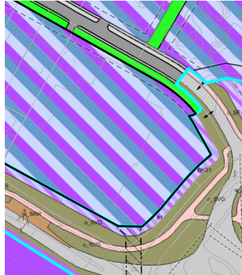
Figur 3 og 4: Gjeldende plan(er).