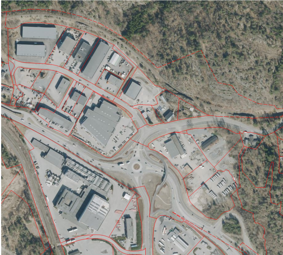
Figur 1: Flyfoto over planområdet