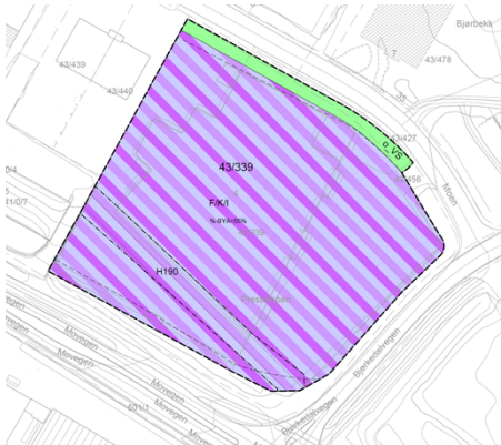
Figur 2: Planforslag.