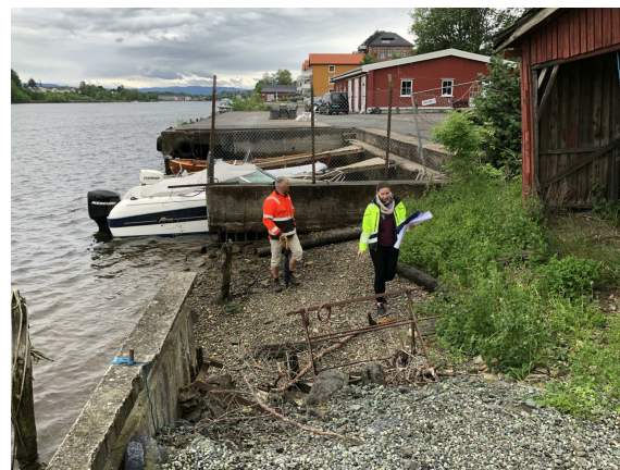
Eksisterende situasjon område 2