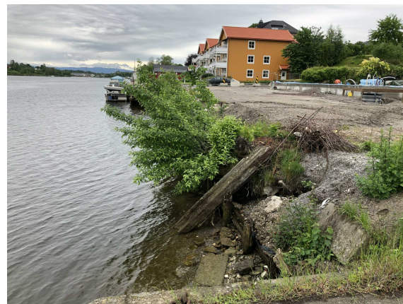
Eksisterende situasjon område 3