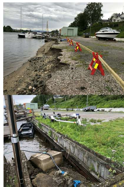
Eksisterende situasjoner område 1

Område 3: Erosjonssikres, ingen konstruksjoner