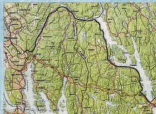
Banestrekning som skal nedlegges.

Det ferdigstilles dobbeltsporet jernbane i ny trasé mellom Larvik og Porsgrunn høsten 2018. Bane NOR (tidligere Jernbaneverket) har da ikke lenger behov for eksisterende jernbanetrasé og ønsker den avhendet. Porsgrunn kommune er forespurt om kommunen ønsker å overta arealet, og må gi en tilbakemelding til Bane NOR innen 01.01.2018 .