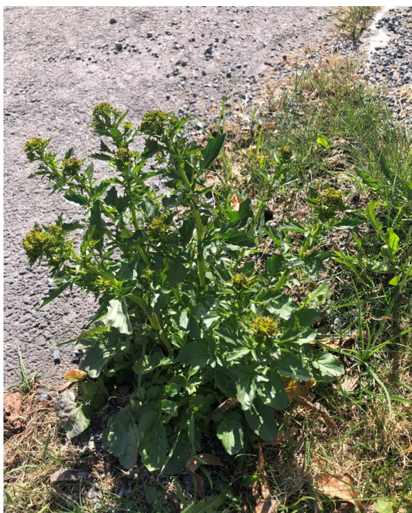
Figur 4-2 Vinterkarse