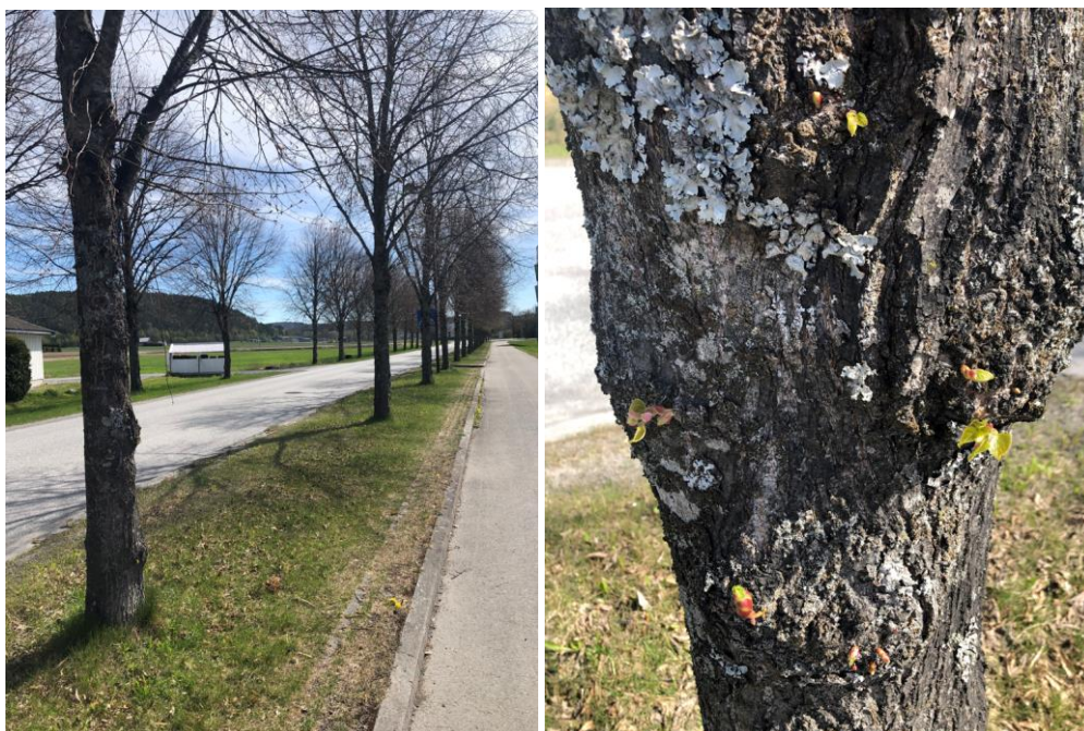
Figur 3-1 Allé langs Kjølnes ring med parklind

Planområdet består hovedsakelig av asfaltert parkeringsplass og bygg med omkringliggende grøntstruktur. Trær og planter som finnes i grøntstrukturen er plantet inn i nyere tid, blant annet alleen langs Kjølnes Ring som består av yngre lindetrær (sannsynligvis parklind) med omkrets på ca. 30 cm.